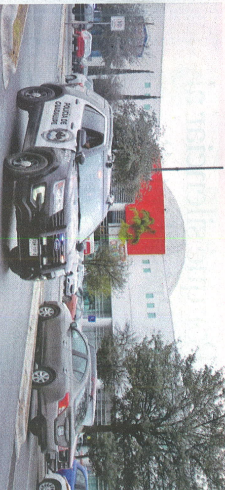
Municipio de Guadalupe atribuye baja delictiva a la creación de la Unidad Guardián, la cual realiza rondines en plazas comerciales